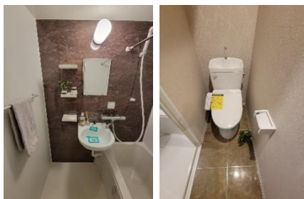
当社施工例 (※家具は別売りとなります。)