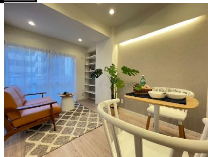
室内写真（家具は別売りとなります。）