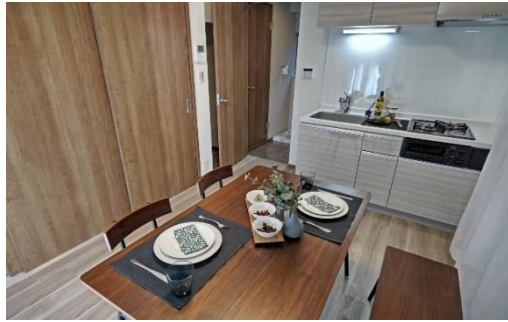
室内写真（※家具は別売りとなります。）