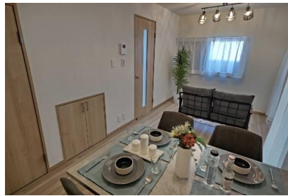
室内写真（※家具は別売りとなります。）

ローンお支払い例 セゾンファンデックス利用時 頭金114.0万円 借入金額2,658万円 変動金利3.6% 35年・ボーナス払いなし 月々 111,398円 投資用物件としても 想定月額賃料約195,000円×12ヶ月=年間収入2,340,000円 想定表面利回り約6.16%