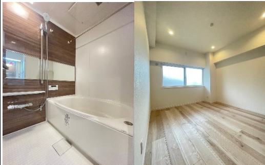
室内写真 (家具は別売りになります。)