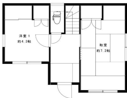
1階（洋室1・和室1・トイレ・カースペース）

◎平成6年築安心の新耐震基準物件！◎南東向きにつき陽当り・通風良好！ ◎淵野辺公園まで徒歩7分、第一種中高層住居専用地域の閑静な住宅街につき住環境良好！